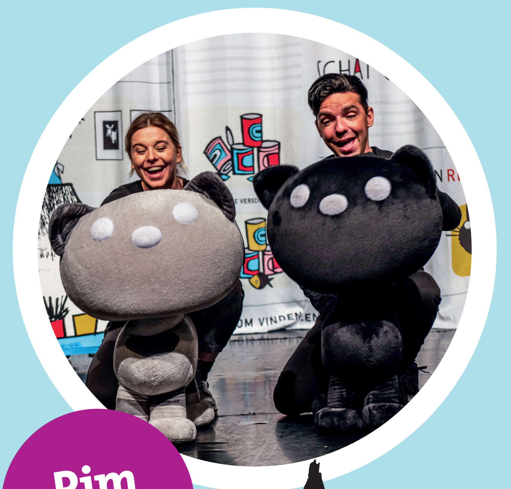
Pim & Pom